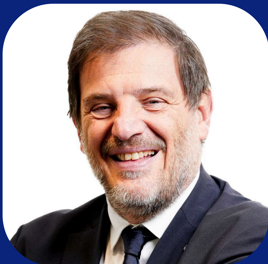
Florian GRILL Président de la FFR

Le rugby français entre aujourd’hui dans un nouveau cycle. Cette nouvelle convention marque une étape déterminante et traduit une volonté claire : avancer ensemble, avec lucidité et ambition, au service de l’intérêt général du rugby.